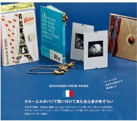
SOUVENIR FROM PARIS

人気ベーカリー《デュヌ・ラルテ》の スペシャルなメロンパン 仏語で「糖にも糖をも」という意味を持つ数多の人気のパン 《デュヌ・ラルテ》は、40年以上の歴史を誇るパリに ルンブルグにある老舗パン屋の集まり。 www.dunelart.com